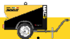
ESSIEU PREMIUM 04.