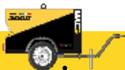
ESSIEU STANDARD 03.